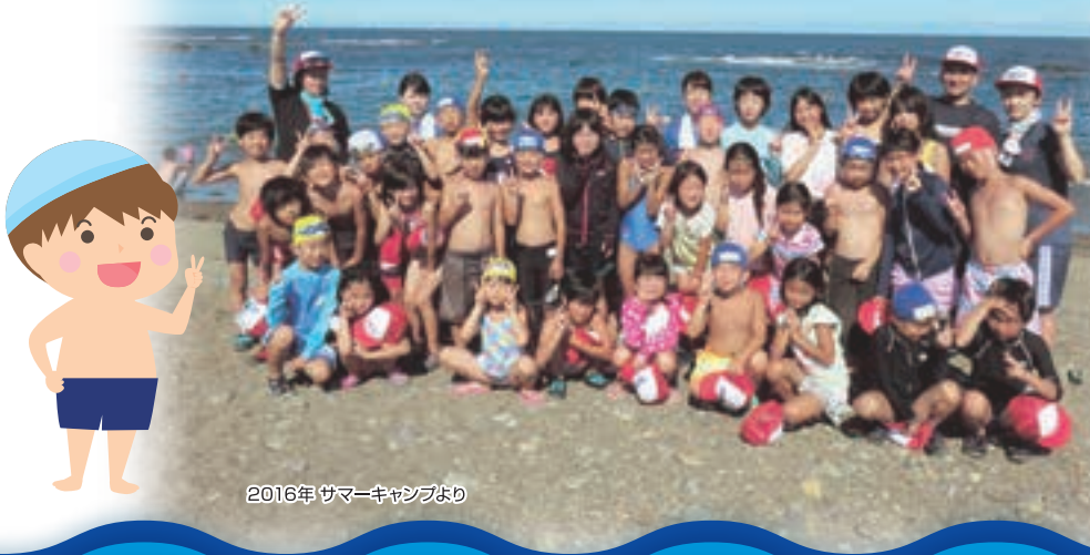
2016年 サマーキャンプより